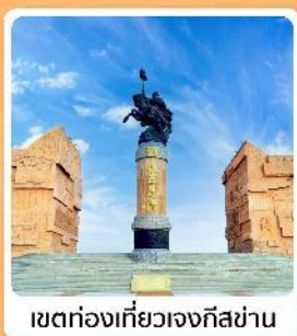
เขตท่องเที่ยวเจงกิสข่าน