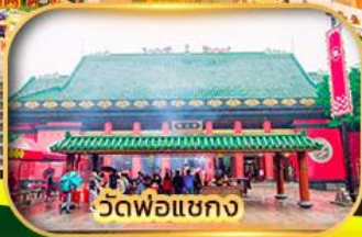
วัดพ่อแซง