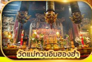
วัดแม่กวนอิมของอ่า