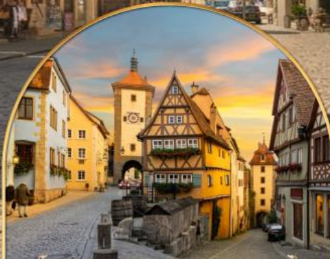
เฟลลินไลน์