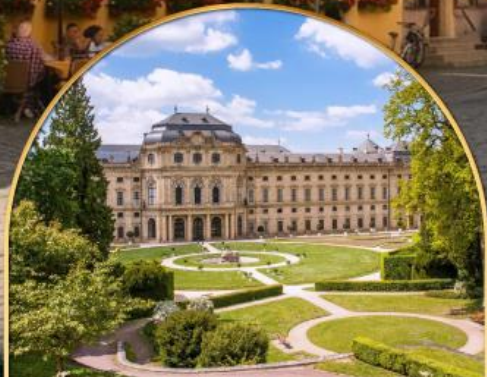
พระราชวังแวร์ซายส์ ฝรั่งเศส