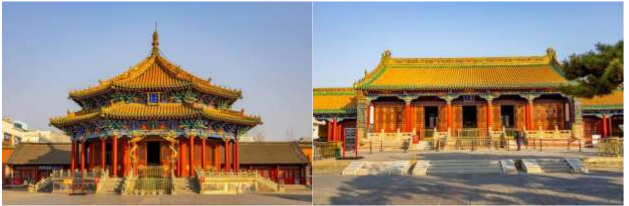
ประทับขององค์จักรพรรดิเมื่อครั้งเสด็จเยือนทางเหนือ

นำท่านเดินทางสู่ พระราชวังกู้กงเส้นหยาง โบราณสถานจากสมัยต้นราชวงศ์ชิง ที่ได้รับการดูแลรักษาเป็นอย่างดี และมีลักษณะคล้ายคลึงกันมากกับพระราชวังหลวงที่กรุงปักกิ่ง สร้างขึ้นเมื่อปี ค.ศ.1625 ภายหลังจากที่ราชวงศ์แมนจูได้สถาปนาให้เส้นหยางเป็นราชธานี ประกอบด้วยตำหนักใหญ่น้อยกว่า 300 ห้องบนพื้นที่กว่า 60,000 ตารางเมตร ภายหลังจากที่ราชวงศ์หมิงถูกโค่นล้มลง (ค.ศ.1368-1644) ชาวแมนจูก็ได้สถาปนาราชวงศ์ชิงขึ้น ได้ย้ายเมืองหลวงไปอยู่ที่กรุงปักกิ่ง และใช้เส้นหยางเป็นเมืองหลวงแห่งที่สอง รวมทั้งใช้พระราชวังแห่งนี้เป็นที่