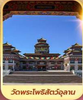
วัดพระโพธิสัตว์จุลาน