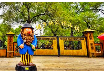
หมู่บ้านรัสเซีย

นำท่าน นั่งกระเช้าชมความสวยงามของแม่น้ำซวงวาเจียงในฤดูหนาว 乘缆车跨越松花江 แม่น้ำสายหลักที่ไหลผ่านเมืองฮาร์บิน ในช่วงฤดูหนาวน้ำในแม่น้ำซวงวาจะกลายเป็นลานน้ำแข็งขนาดใหญ่และปกคลุมด้วยหิมะ ชม หมู่บ้านรัสเซีย 俄罗斯小镇 ชมบ้านเรือนและรีสอร์ทสไตล์รัสเซียรวม 27 หลังภายในหมู่บ้านเล็ก ๆ แห่งนี้ ตั้งอยู่บนเกาะพระอาทิตย์ 位于太阳岛上 เมื่อนักท่องเที่ยวมาเยือนในหมู่บ้านเสมือนท่านกำลังเดินเล่นอยู่ในหมู่บ้านหนึ่งใน รัสเซีย