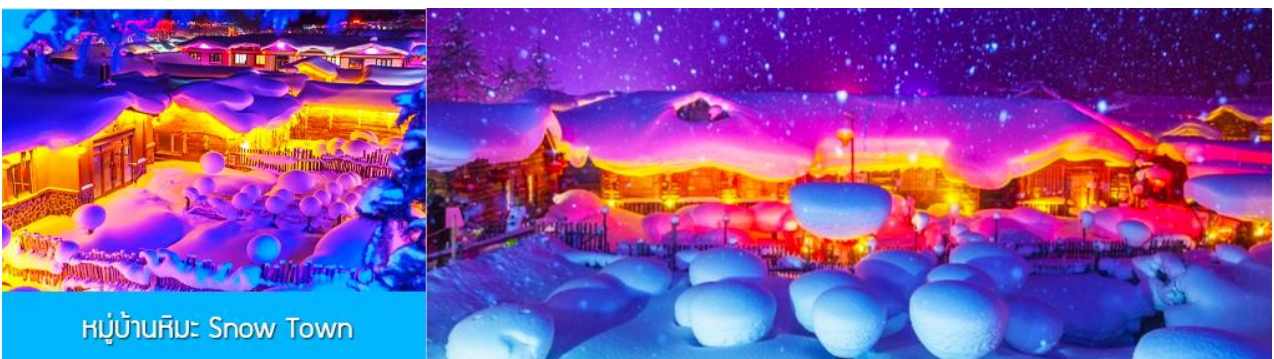
หมู่บ้านหิมะ Snow Town

ท่ามกลางท้องทุ่งและผืนป่าที่ปกคลุมด้วยหิมะราวกับอยู่ในโลกแห่งเทพนิยาย ผ่านหมู่บ้าน เว่ยหูจ้าย 威虎寨 ที่อดีตเคยเป็นที่ตั้งของรังโจรที่มักออกปล้นสะดมชาวบ้าน ม้าลากเลื่อนเป็นยานพาหนะเฉพาะพื้นที่ ๆ ที่นิยมนำมาใช้ในการเดินทางหรือลำเลียงสิ่งของในช่วงฤดูหนาว ที่ใช้ม้ามาลากจูงแคร่เลื่อนให้สามารถเคลื่อนย้ายบนลานหิมะได้