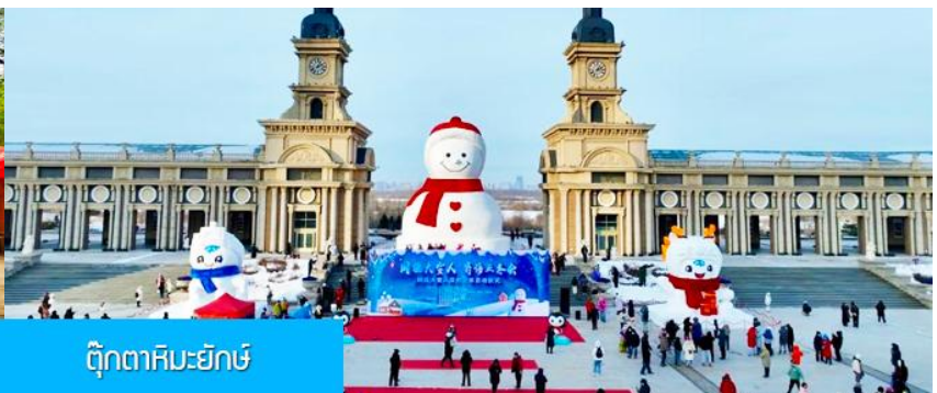
ตุ๊กตาหิมะยักษ์