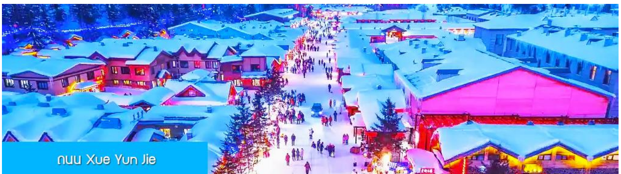
ถนน Xue Yun Jie