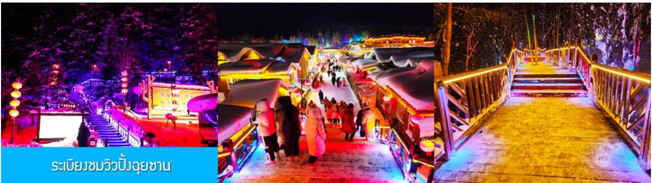
ระเบียบชมวิวยังอุยซาน