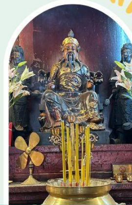
วัดปุกโตฮองฮำ