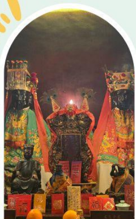
วัดหมิ่นโหมว