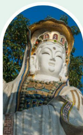
เจ้าแม่กวนอิม ธิพลสัย