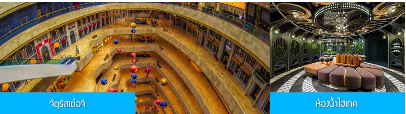
จัตุรัสเต๋อจี