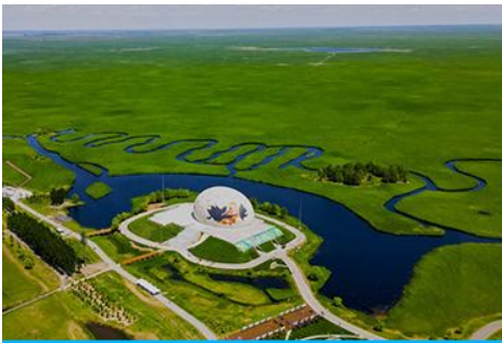
อุทยานชุ่มชื้นจาหลง

เช้า รับประทานอาหารเช้า ณ ห้องอาหารของโรงแรม (7)