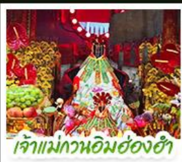
เจ้าแม่กวอนอิมฮองฮ่า