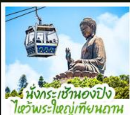
นั่งกระเช้าหนองปีง ไหว้พระใหญ่เทียนถาน