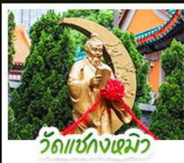
วัดซ่งก่งเมียว