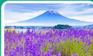
สวนโออิชิปาร์ก