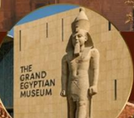
พิพิธภัณฑ์แกรนด์อียิปต์