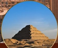
พีระมิดชั้นบันได