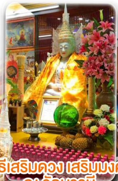
พิธีเสริมดวง เสริมมงคล ณ วัดบารมี

ได้เวลาอันสมควร ตามเวลานัดหมาย นำท่านเดินทางสู่ สนามบินเพื่อทำการเช็คอินเอกสารแก่ท่าน