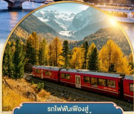
รถไฟฟันเฟืองสู่ยอดเขากรอนเนอร์เกรต