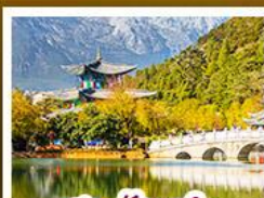
สระมั่งกรต้า