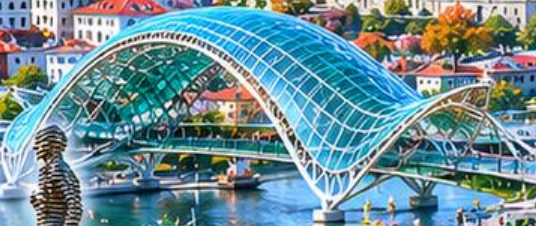
BRIDGE OF PEACE สะพานสันติภาพ