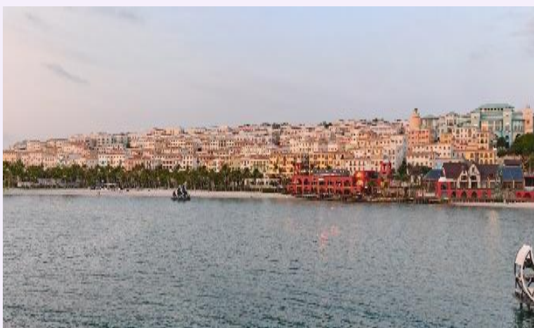
SUN SET TOWN หรือ เมืองเมดิเตอร์เรเนียน (Mediterranean Town) สถาปัตยกรรมจำลอง บ้านสไตล์เมดิเตอร์เรเนียนหลากสีติดริมทะเล ตั้งอยู่บนเนินเขา จุดศูนย์กลางของเมืองคือหอ นาฬิกาอิฐสีแดงสูงถึง 75 เมตร หันหน้าไปทาง ทะเล