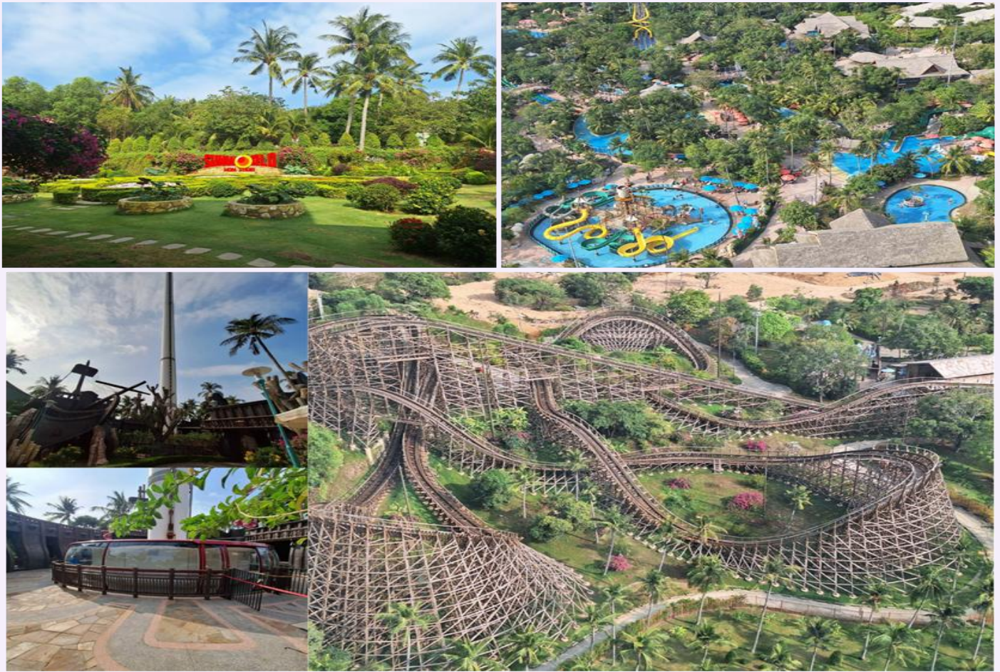
ได้เวลาอันสมควร นำท่านนั่งกระเช้ากลับสู่ฝั่งฟูกีว