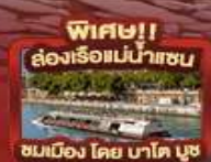
พิเศษ!! ล่องเรือแม่น้ำเซน ชมเมือง โดย บาโต บูช