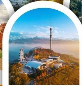
จุดชมวิวเขาค็อกโทเบ