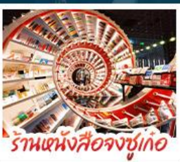
ร้านหนังสือจงซูเกอ