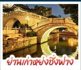
ย่านเก่าเซียงซังฟาง