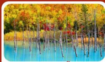
บลูพอนด์ (บ่อน้ำสีฟ้า)