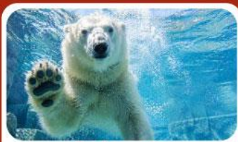
สวนสัตว์อาซาฮิยามะ