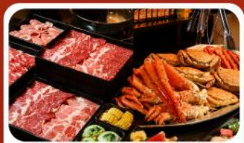
บุฟเฟ่ต์ซาบู ซาบู 3 ชนิด