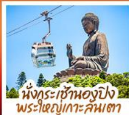
นั่งกระเช้าองปิง พระใหญ่เกาะคิมเตา