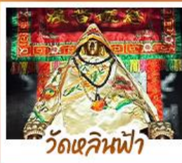
วัดเสียนฟ้า