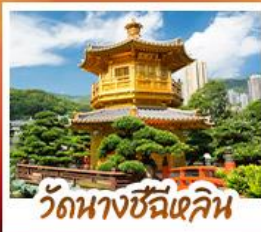
วัดนางชีฉีเสียน