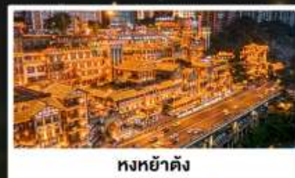
หงหย่าตั้ง