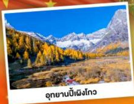
อุทยานปี้ฝิงโกว