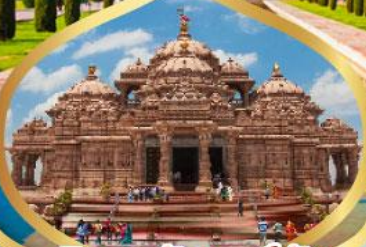
วิหารอักซาร์ดีม