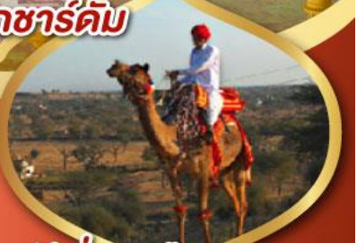
ฟรี ขี่อูฐ เมืองมันทอวา ราคาเริ่มต้น