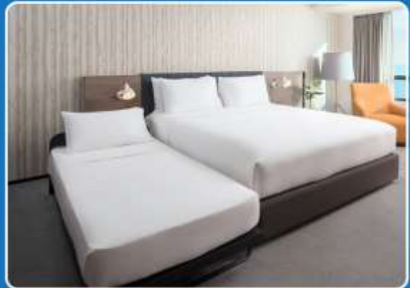
👤👤+👤 TRIPLE (TRP)

**รูปภาพห้องพักเป็นเพียงภาพสื่อถึงประเภทของเตียงเท่านั้น ไม่ใช่ภาพห้องพักจริงสำหรับการเข้าพัก**