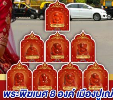
พระพิฆเนศ 8 องค์ เมืองปูणे