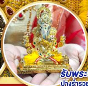
รับพระพิฆเนศ ปางรำรอย ท่านละ 1 องค์