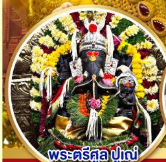
พระตรีศูล ปูणे (Trishul Pune)