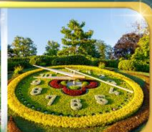
นาฬิกาดอกไม้เมืองจนีวา