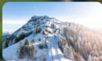
พิชิต 3 ยอดเขาดัง Rigi / Schilthorn / Gornergrat