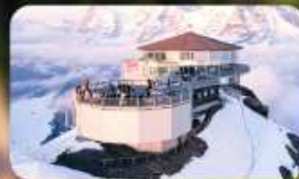
ทานอาหารที่ Piz Gloria ภัตตาคารที่หมุนได้ 360 องศา